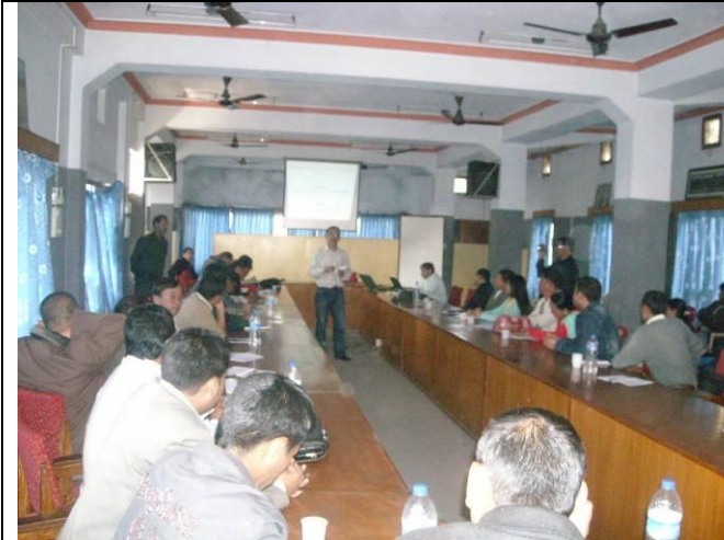
दीर्घकालिन सोच्ने निधारण कार्यक्रममा GTZ / udle का शहरी योजना विद्र