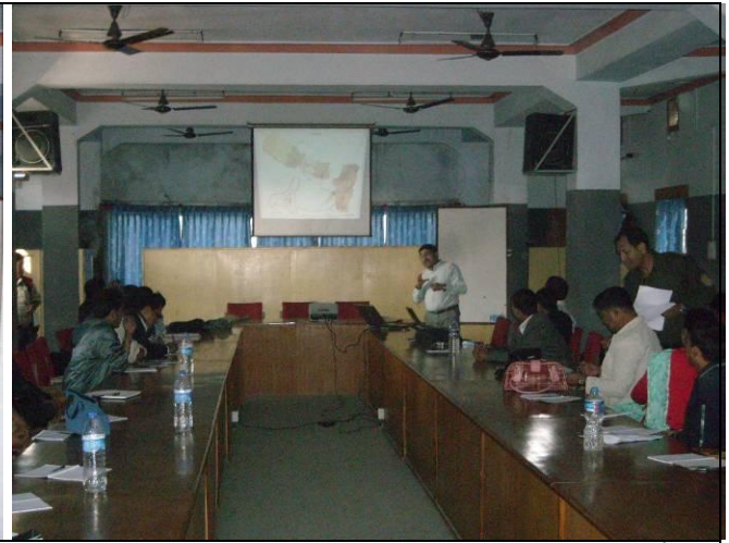
दीर्घकालिन सोच्ने निधारण गोष्ठी कार्यक्रममा प्रगति विवरण प्रस्तुतिकरण गदै परामर्शको टोली प्रमुख