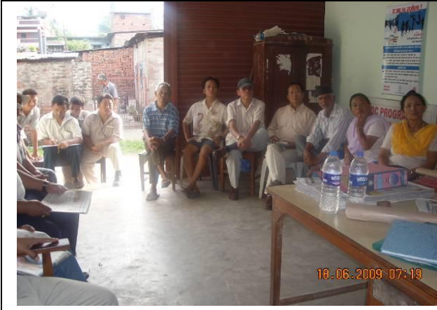
वडा भेलामा समस्या प्रस्तुत गर्दै सहभागी