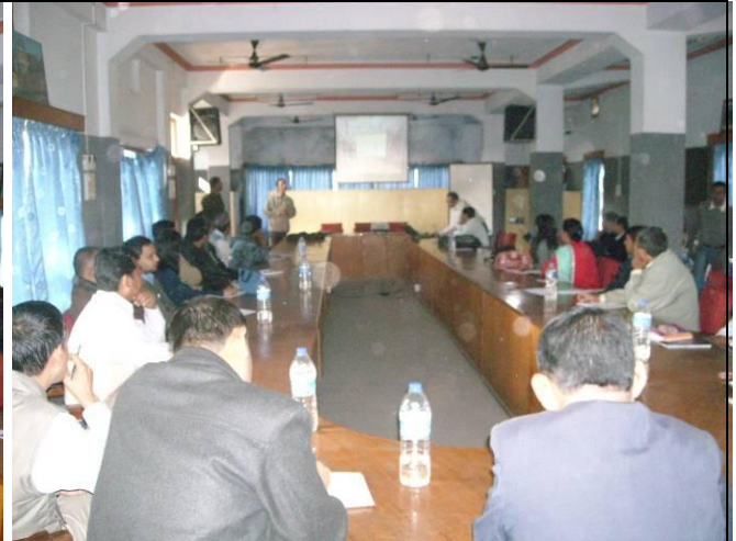
दीर्घकालिन सोच्ने निधारण कार्यक्रम