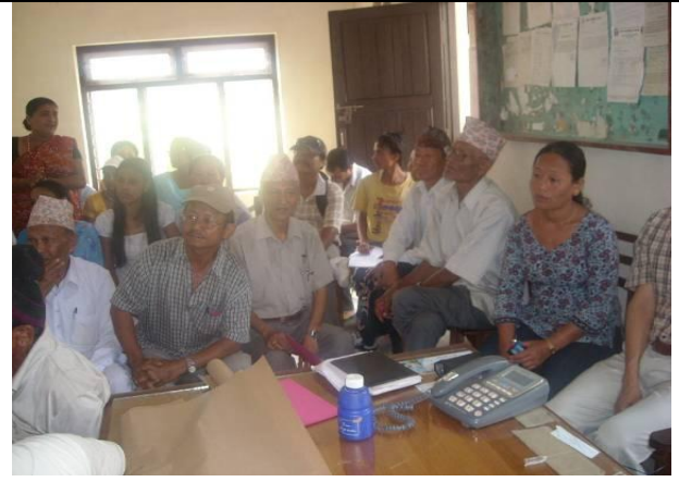
वडा भेलाको दृश्य

वडा भेलामा स्थानीय सहभागीहरुबाट नै समस्या संकलन गरिएको छ । वडागत समस्याहरुलाई बुँदागत रुपमा माग भई आएका कार्यक्रमको रुप दिइएको छ भने समस्याहरुलाई विषयगत (Sectoral) शिर्षकमा समूहिकृत गरी वडागत रुपमा समस्याहरुको स्तरिकरण ९चलपल्लन० गरिएको छ (तालिका नं. ३.२) ।