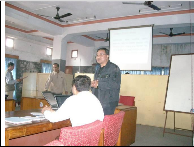
दीर्घकालिन सोच्ने निधारण गोष्ठी कार्यक्रममा प्रस्तुतिकरण गदै श.वि.भ.नि.वि.का डि.इ.